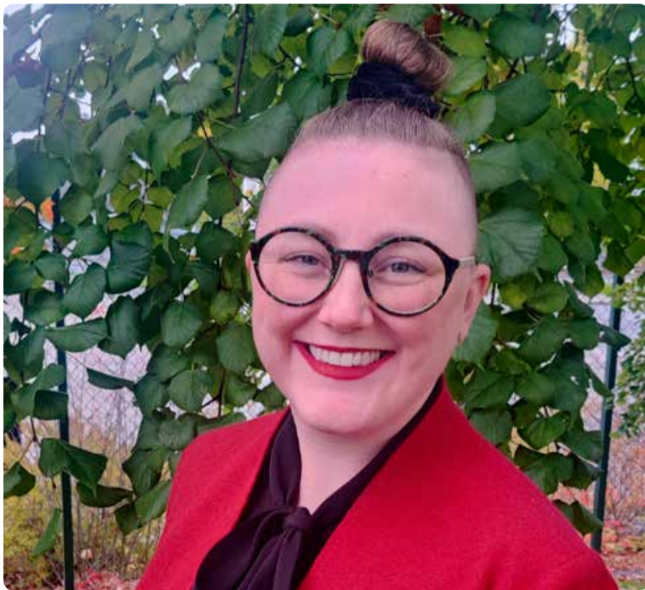
Jag är stolt över att Vänsterpartiet drivit fram två EU-lagar som stärker kvinnors rättigheter.

EU ska inte ha en gemensam utrikespolitik, men det finns situationer där EU kan agera med enad röst och då är det viktigt att vänstern är stark i EU.