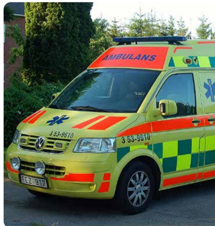
Ska det bli sällsynt att se en ambulans i Mullsjö i framtiden?

Ambulansverksamheten måste alltså bli bättre – men det krävs att länets invånare uppvakter region Jönköpings läns politiker och framför detta. Inte minst måste Mullsjö kommuns politiker markera mot regionpolitikerna att ambulansverksamheten i vår kommun måste bli bättre. ■