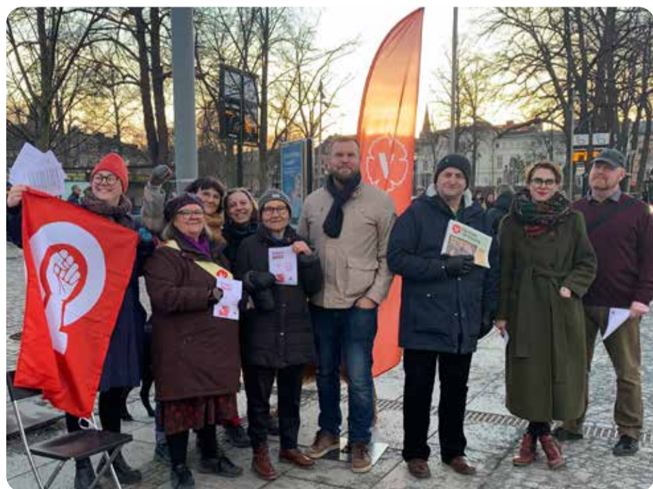
Vänsterpartiet kampanjar på Vindbron i Jönköping på Internationella Kvinnodagen 8 mars.