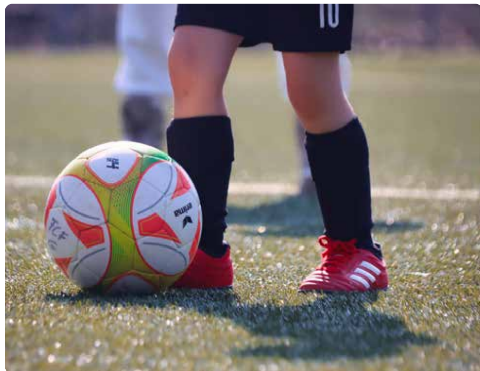
Mikroplasten måste bort för att inte spridas i dagvattenbrunnar.

Möte kl 12.00 på torget Tal och musik. Välkomna!