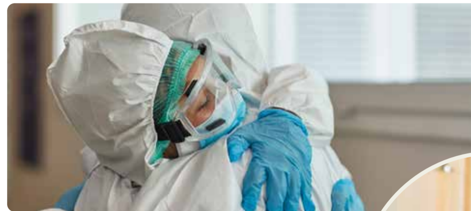
Pandemin visade på brister i välfärden. Vänsterpartiet vill bygga samhället starkt igen.

gav är borta. Skolorna drivs för att tjäna pengar istället för att ge utbildning. Vården har man privatiserat, sålt ut och underfinansierat, så att mindre och mindre pengar finns till läkare och undersköterskor. Skulle vi bli sjuka eller arbetslösa kan vi inte vara säkra på att ersättningen går att leva på. Behöver vi en plats på BB kan vi inte vara säkra på att det finns en ledig, behöver vi en ambulans kan vi inte vara säkra på att den kommer i tid. Vi kan inte lita på att skolan har resurser nog att ta hand om våra barn, unga vuxna kan inte flytta hemifrån för att det är sådan bostadsbrist. Det är inte någon naturlag